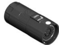
Polbild Ansicht steckseitig

E ST B 205 NN 00 32 0003 000 E S B 205 N 00 32 0003 000