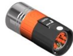
Polbild Ansicht steckseitig

E ST A 201 NN 00 32 0500 000 E S A 201 N 00 32 0500 000