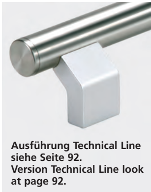
Ausführung Technical Line siehe Seite 92. Version Technical Line look at page 92.

Other handle lengths or colour combination on request.