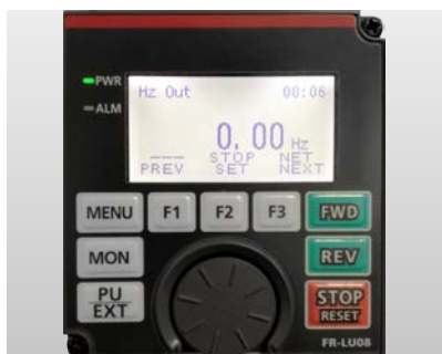
FR-LU08 mit Volltextanzeige in bis zu fünfzehn Sprachen und mit Echtzeituhr.

Mit dem integrierten „Digital Dial“ der Bedieneinheit hat der Anwender einen direkten Zugriff auf alle wichtigen Parameter. Entscheiden Sie sich für die Bedieneinheit, die Ihren Anforderungen gerecht