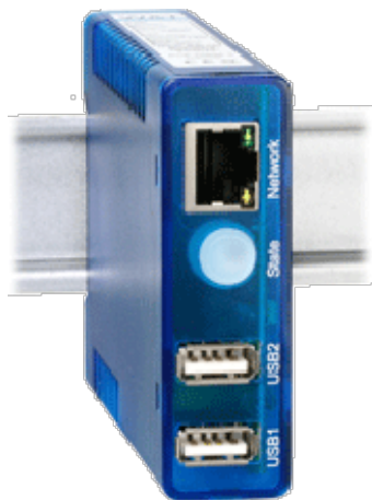
USB-Server Industry Isochron, Typ #53642